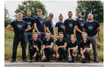
La promotion de juin

ments que nous partageons étaient forts. Tous les responsables et les intervenants du stage ont été exemplaires de courage, de dynamisme et de bienveillance. Merci d'avoir travaillé d'arrache-pied pour nous proposer de si belles expériences et nous propulser plus vaillants sur les chemins de la Vie ! » (Anselme).