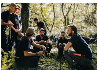
Activités en forêt de Brocéliande