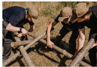
Atteindre des objectifs en équipe

relle, et les stagiaires ont ainsi (ré)appris à vivre au sein du monde vivant, qui est notre berceau et notre matrice. Les nombreuses activités et chantiers ont développé la camaraderie et l'esprit d'équipe, et tous nos jeunes volontaires ont achevé leur parcours avec la volonté de bâtir avec confiance et détermination leur avenir et l'avenir de territoires humains et résilients. Six d'entre eux approfondissent leur formation chez nous, en réalisant des missions de développement de nos différents projets: jardins maraîchers, solidarité aux plus démunis,