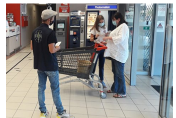
Collecte de dons alimentaires

Nous avons été rejoints pour cela par des jeunes effectuant une mission d'intérêt général pour leur Service National Universel (SNU). Ils s'intègrent dans les équipes d'Irvin et participent à chacune de ces actions.