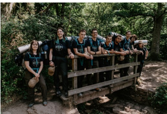
La promotion de juillet

Les stages de juin et juillet ont chacun réuni un total de dix-huit volontaires, dont un tiers de filles, et se sont déroulés sur notre ferme à Mouazé