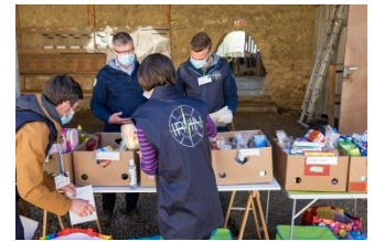
Récupération des commandes par les bénévoles

Irvin Solidaire ne s'arrêtera pas avec le déconfinement, et nous travaillons avec les acteurs du territoire à le poursuivre sous d'autres formes.