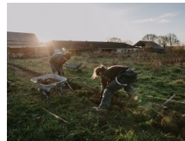
Travail à la ferme

ferme pourra aussi accueillir des activités de formation pour les entreprises et les particuliers, afin de mobiliser davantage d'énergie au service d'une vision commune d'un territoire en harmonie avec les systèmes vivants.