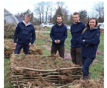
Confiants et déterminés pour le monde qui vient

C'est pour cet objectif qu'Irvin continuera à former des combattants pacifiques, et