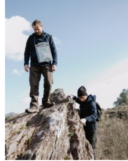
S'entraîner pour affronter et construire l'avenir

necter au monde vivant. Cette vision est une motivation forte pour les volontaires, qui permet de rebondir après de premières expériences parfois douloureuses dans leur vie antérieure. La conviction de co-construire demain dans une vision commune est l'un des moteurs de la formation.