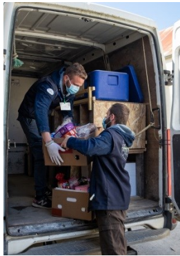
Préparation des commandes

Dès le premier jour du confinement, les jeunes volontaires qui venaient de terminer la session de février ont décidé de se mobiliser au service des personnes vulnérables de Saint Aubin d'Aubigné et Mouazé. En lien avec les mairies et le Super U local, l'opération Irvin Solidaire a permis d'éviter aux personnes âgées ou malades de s'exposer, grâce à un système de commandes et livraisons adapté à cette situation inédite. Elle a aussi mis en place un réseau